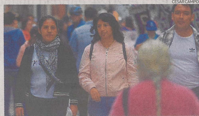
Economía peruana. Se contrajo 0.82% en octubre último.

Salarios reales Gestión (18.12.2023) había informado que el ingreso real de los limeños se estaba alejando aún más del nivel prepandemia. A nivel nacional, la situación no es muy distinta, tal es así que en el análisis del BCP, haciendo una comparación con otros países de la región, los salarios peruanos se mantienen por debajo del 2019, mientras que los de las